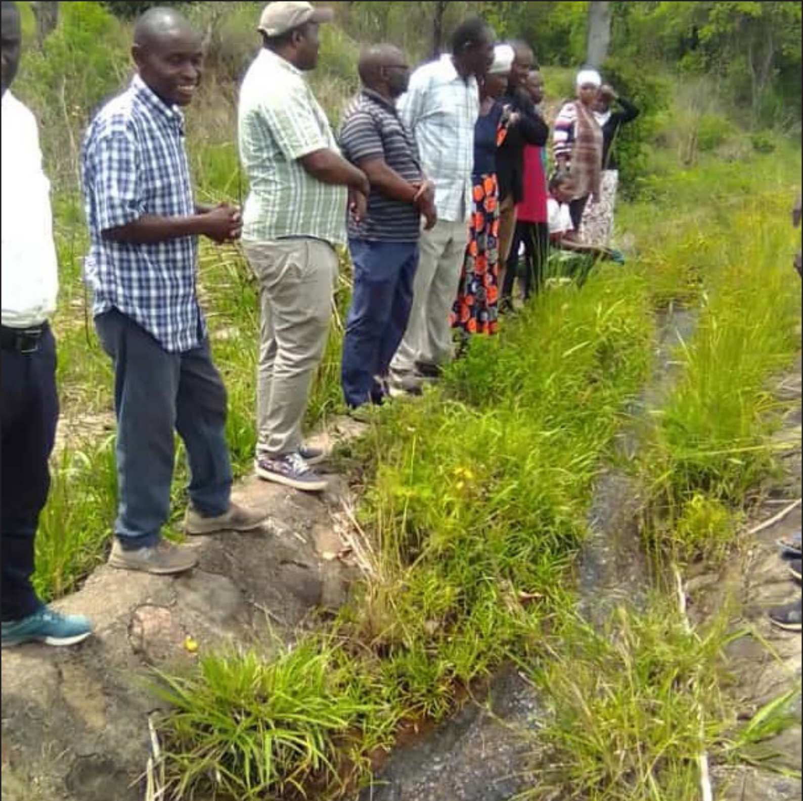
WAVEKEZAJI WA KAMPUNI YA ZERA WAKIANGALIA SHAMBA KWA AJILI YA UWEKEZAJI LIFUA